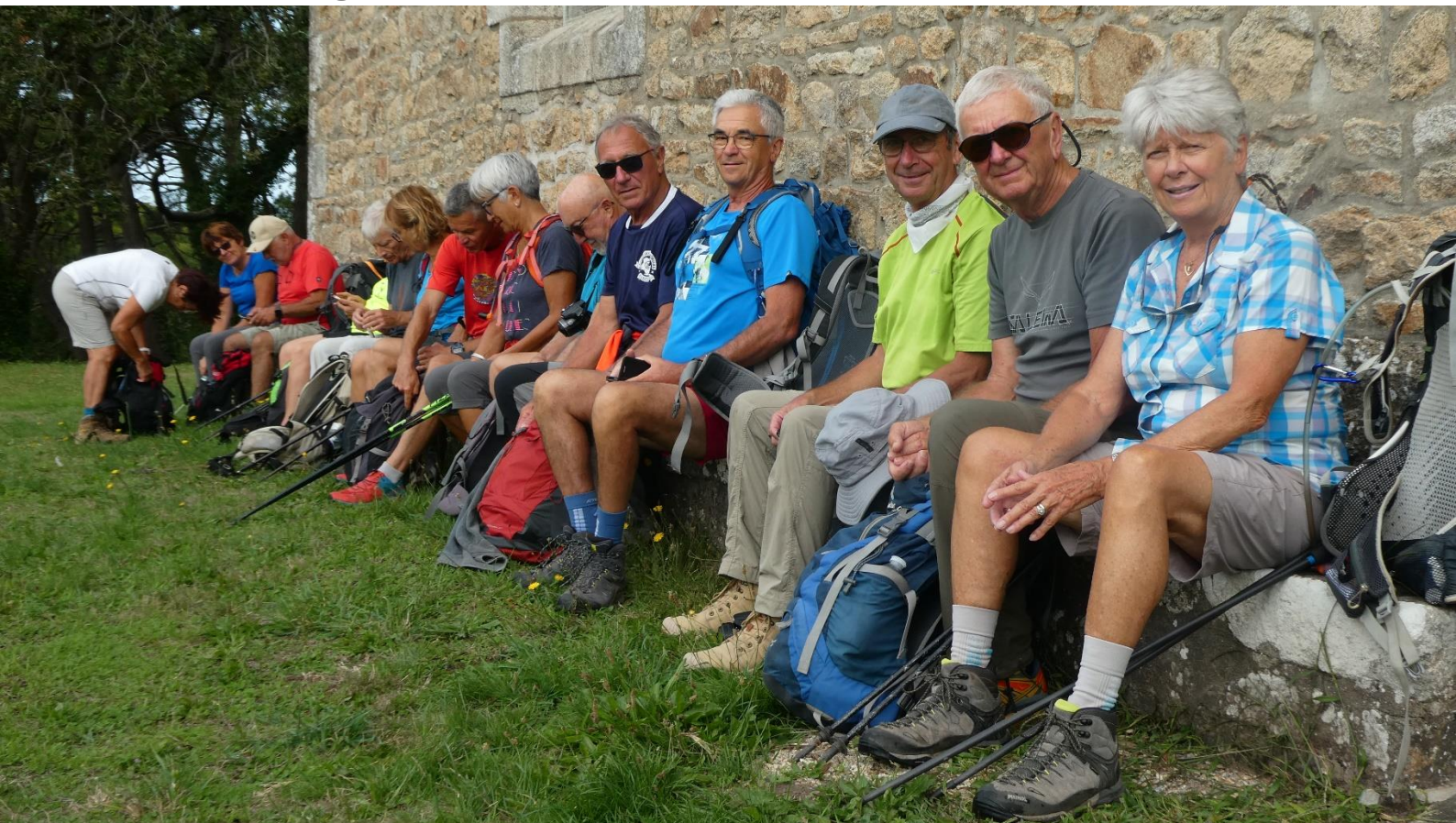
Chapelle Sainte Madeleine située près d'une léproserie