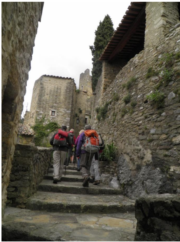
Passage dans les ruelles de St-Montan avant de rejoindre les voitures.