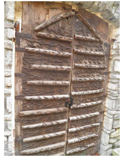
Porte d'entrée d'une maison