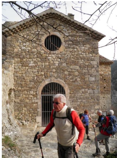
Chapelle St Barthélémy