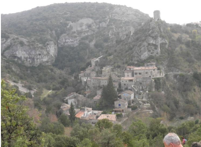
Rochecolombe dans son écrin minéral

Jusqu'au XV e s. les toitures des maisons étaient recouvertes de paille de seigle, les tuiles ne sont apparues sur les maisons populaires qu'à partir du XVI e s.