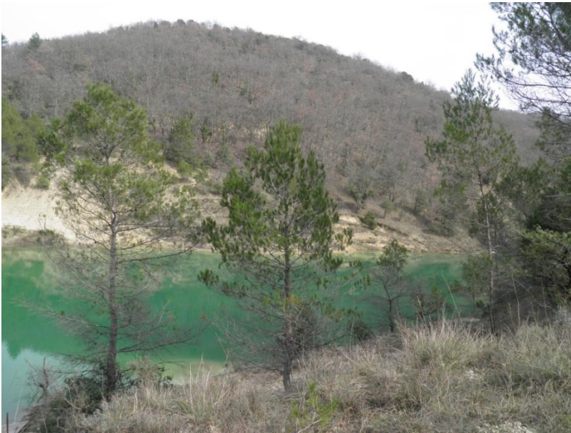
Nous passons près d'une mare aux eaux émeraude.