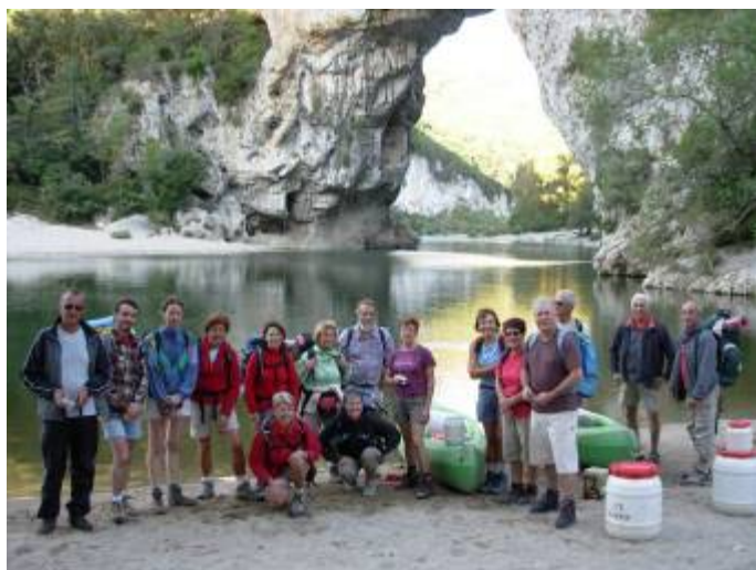
Départ obligé sous le pont d'Arc. Les canoës sont prêts à porter le repas et nos duvets.