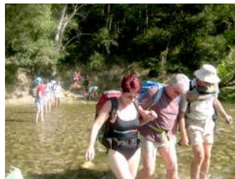
Premier gué. Ce n'est pas un pas de danse, mais L'équilibre que l'on recherche !