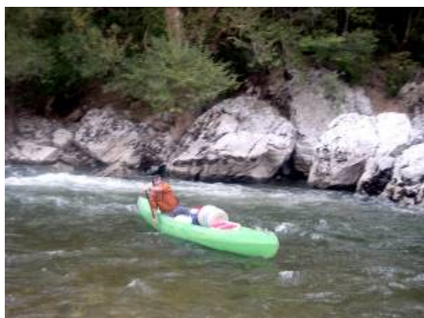
Le fameux rapide de la Dent Noire ! Nous avons des pros !