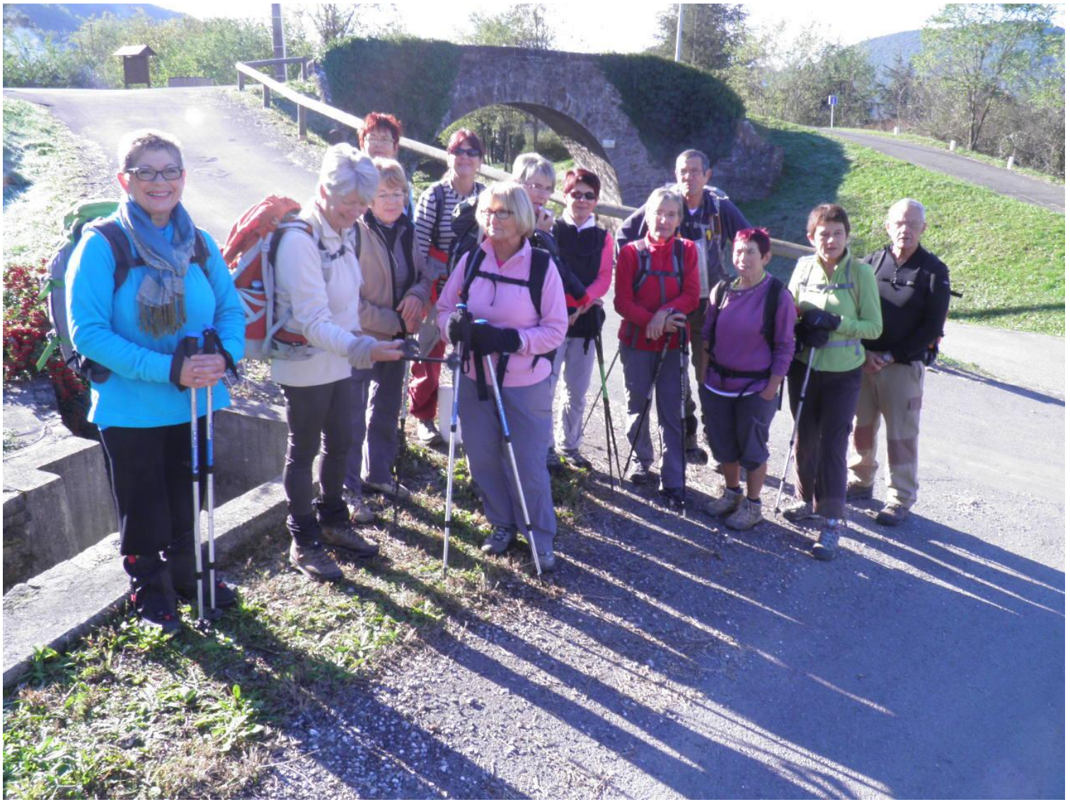
14 participants pour cette sortie que nous avons déjà faite et qui permet d'apprécier un beau panorama depuis la chapelle St Sébastien