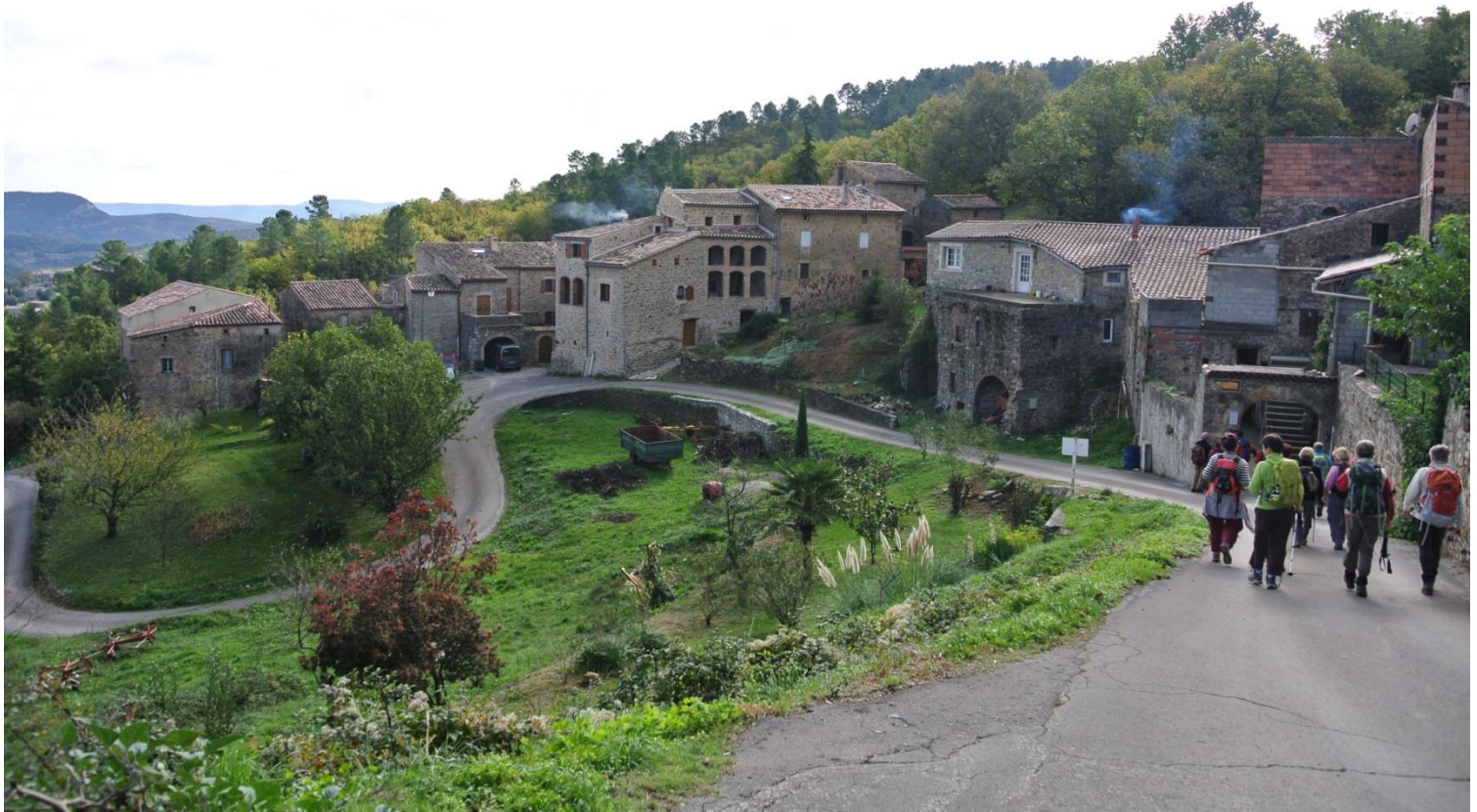
Nous passons au hameau des Thomases et repas dans le Valat de la Font