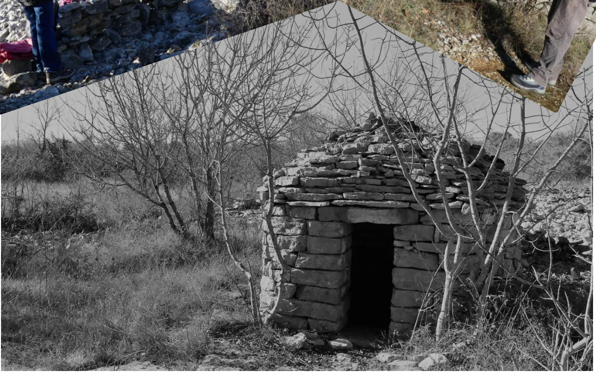
Sur le plateau nous trouvons les Capitelles à côté desquelles nous mangeons