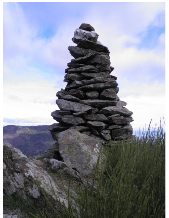
Après 2h de montée, nous atteignons le sommet – le Font de l'Aille à 902 m – et la salle de restaurant se trouve au pied de ce beau cairn, au milieu des genêts, avec vue imprenable.