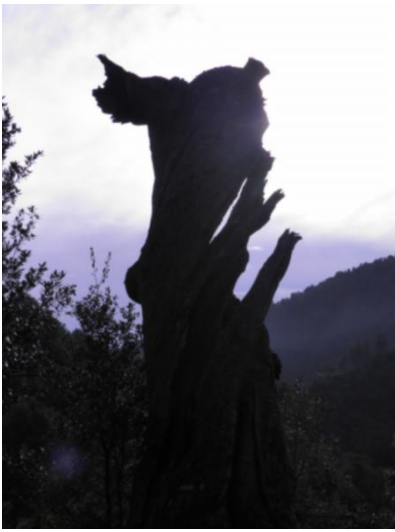
Les restes d'un vieux châtaignier (dommage que la lumière n'était pas la bonne au moment de la prise).