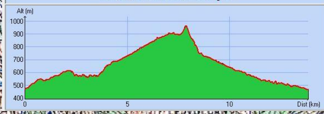
Tracé : Le Ranch CHARRIER Antraigues