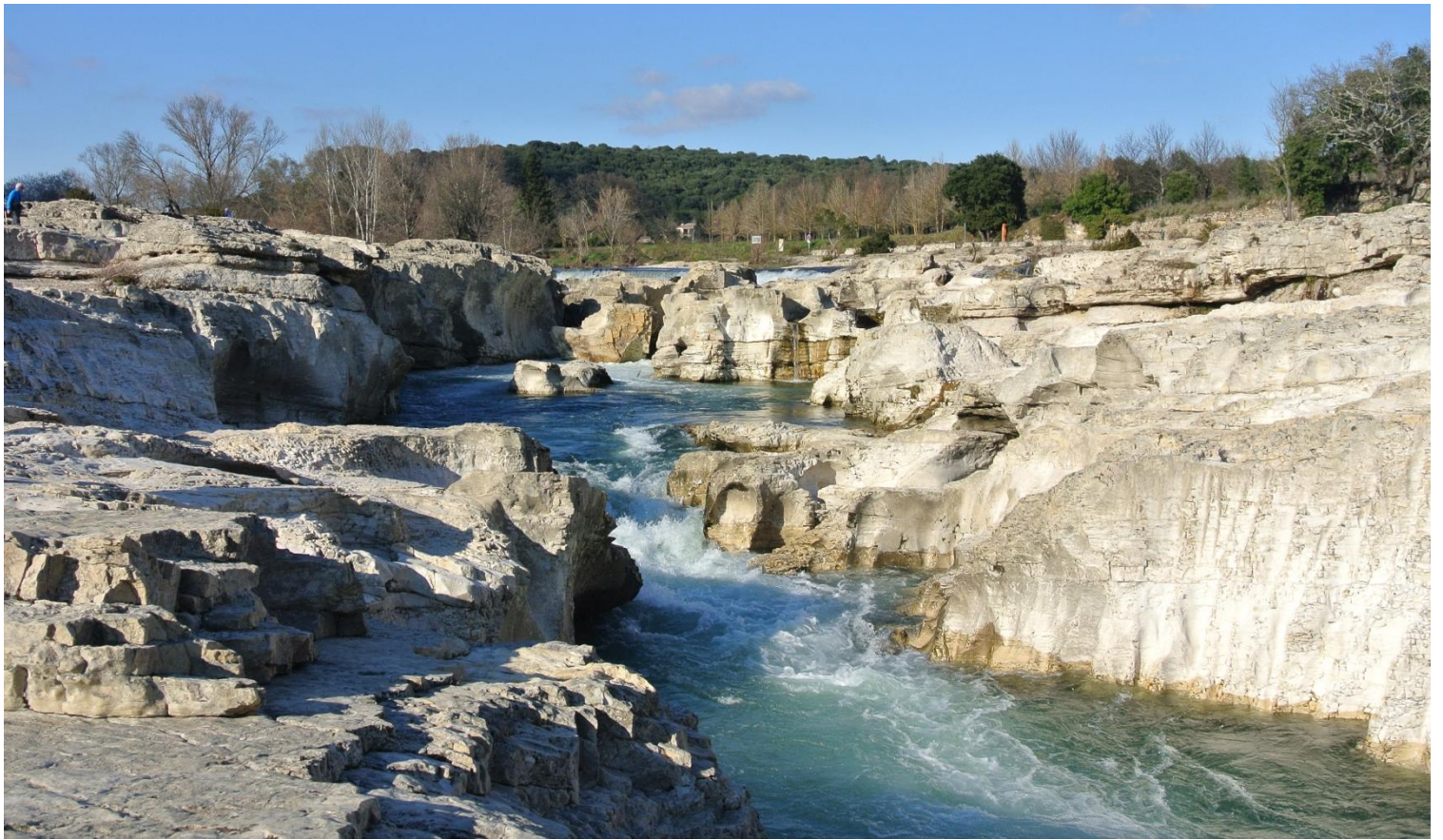
La Roque sur Cèze, village classé parmi les plus beaux villages de France