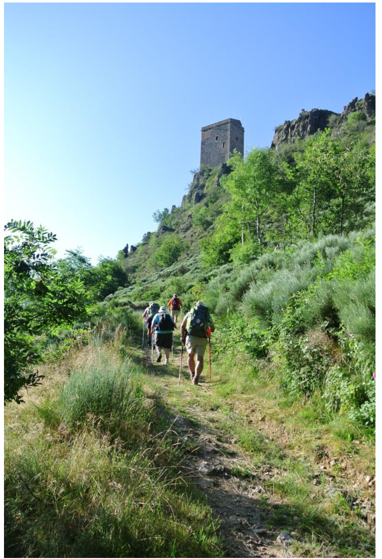
Dominant le village une tour nous attend La montée est rude. Après un cheminement en forêt nous atteignons le sommet d' Esperveluze