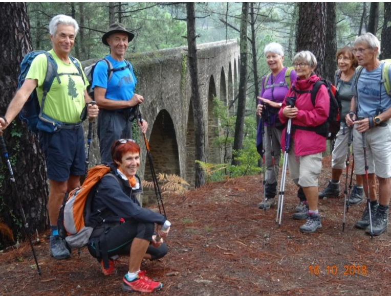
Nous traversons le viaduc et poursuivons sur les calades en grès à travers la forêt de pins et de châtaigniers couverte de fougère. Le chemin est doux sous nos pieds contrairement à nos chemins caillouteux !