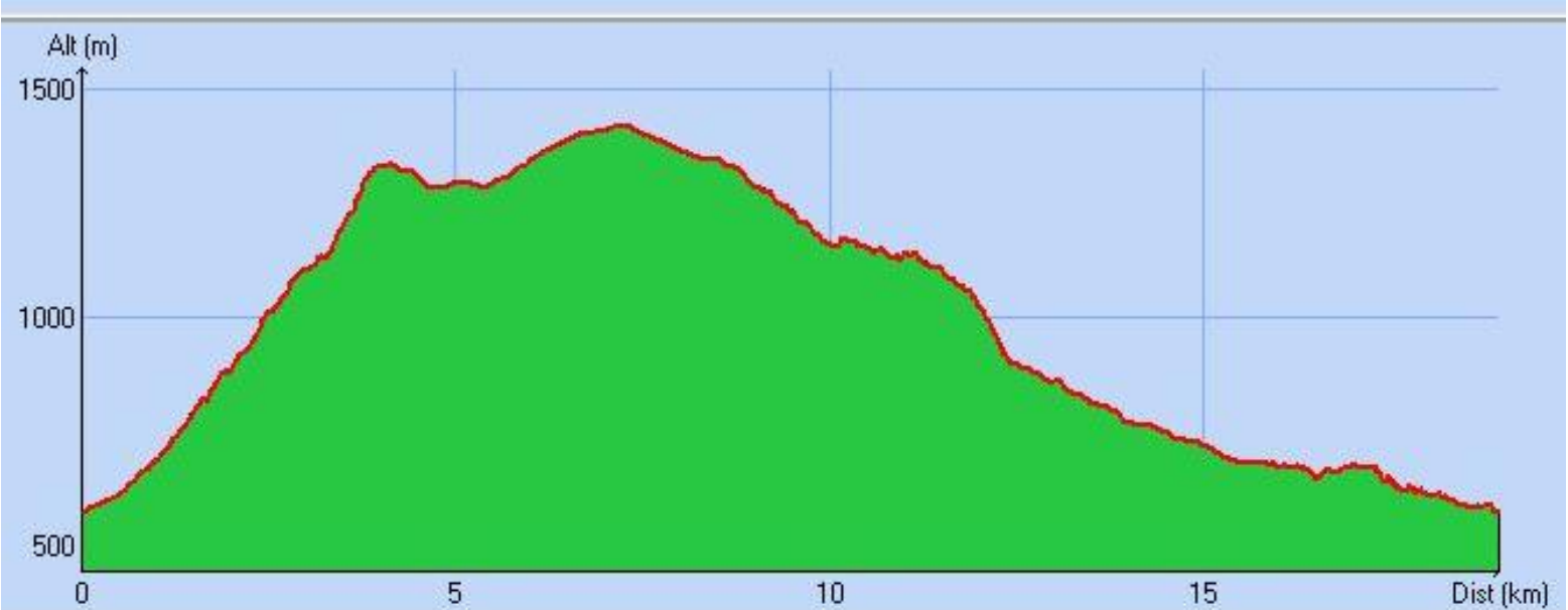
Tracé : Chaumlene-MNT