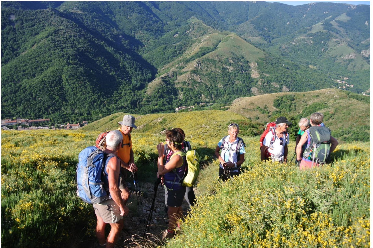
Une pose au milieu des genets en fleurs avant de continuer notre ascension