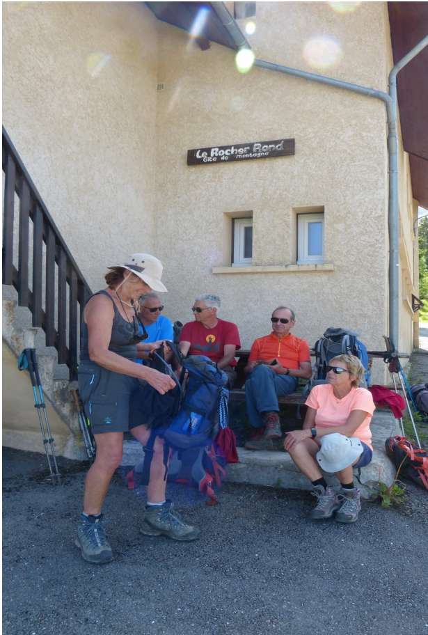
Magnifique journée ; nous serons seuls dans le dortoir 13 lits .... Les ronfleurs ont été mis au ban voir même à l'arrière ban comme d'habitude....