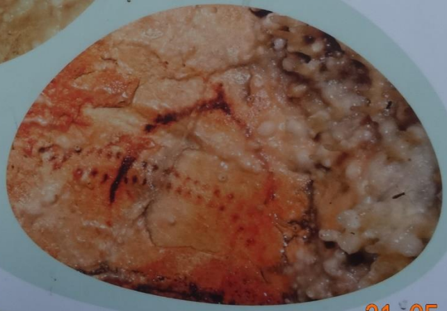
Petit mammouth peint en rouge