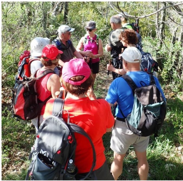
Pendant les pauses on en profite pour faire une récupération active des muscles de la langue