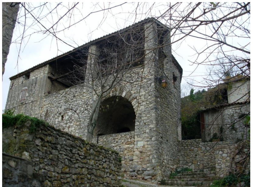
Maison du village de Chames