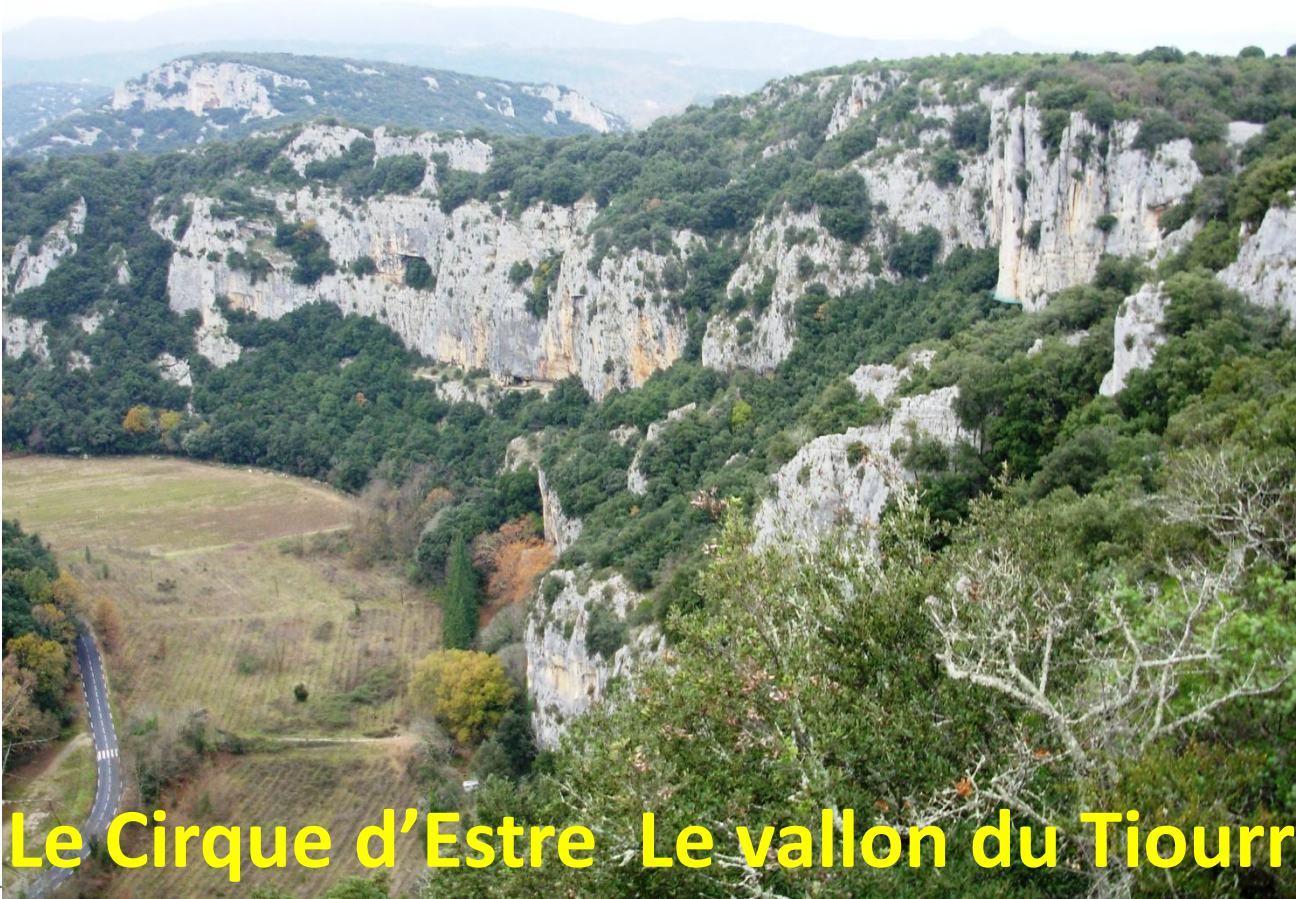
Le Cirque d'Estre Le vallon du Tiourre