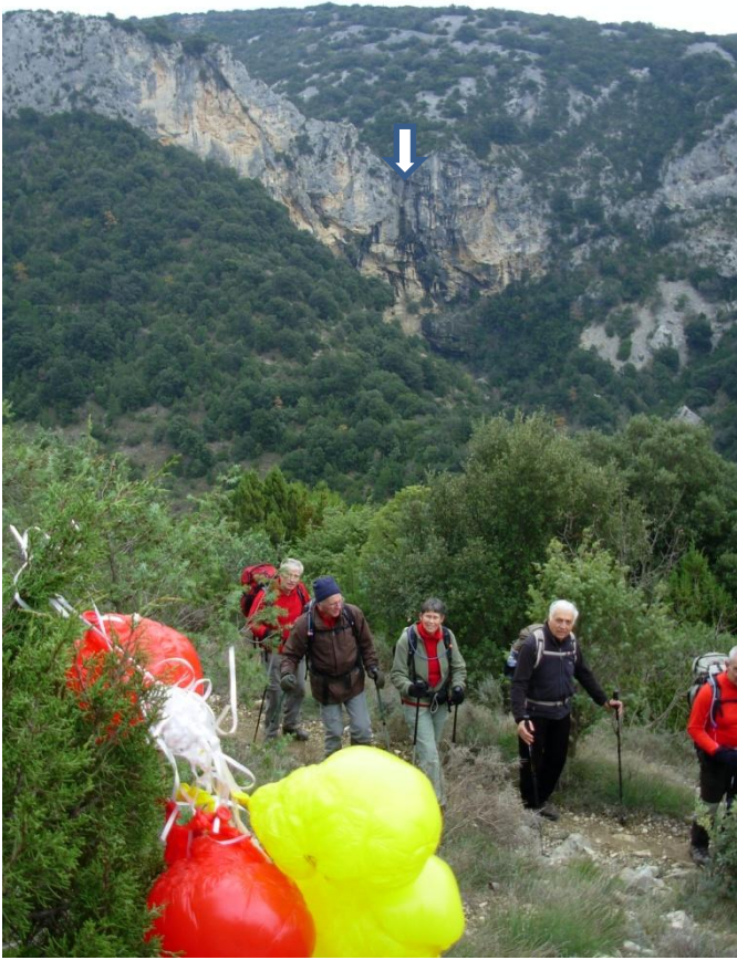
Ballons venus d'Espagne . Au fond la cascade de Pisse vieille