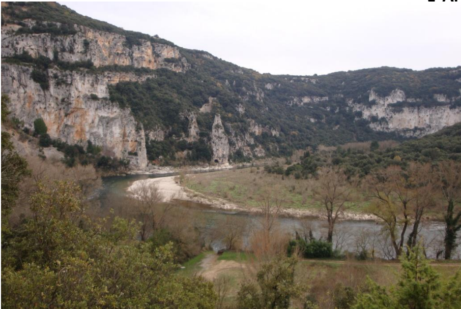
Entrée des gorges L' Aiguille de Chames