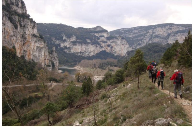
Au bout du vallon nous retrouvons L' Ardèche