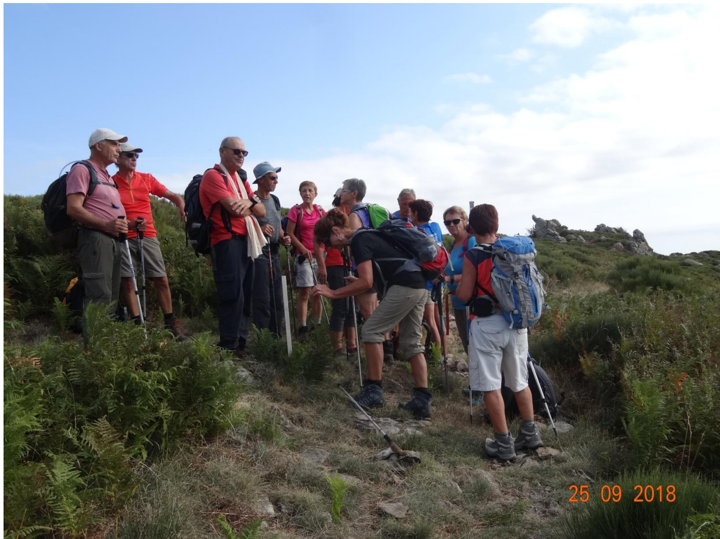
Regroupement de la troupe avant d'atteindre l'objectif du jour.