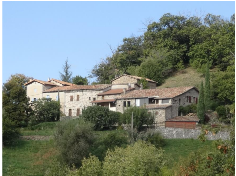
Au dessus un joli hameau.