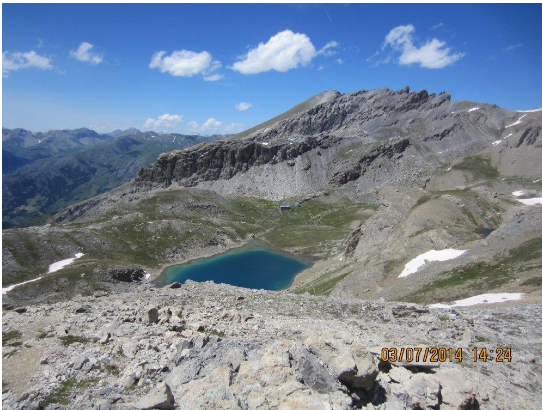
Du col, superbe vue sur le lac Premier et le refuge de Chambeyron.