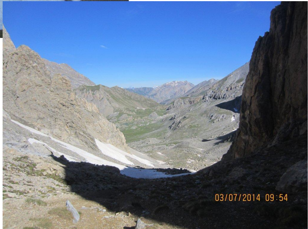
Le col de la Portiolette (2692m) nous offre de nouveaux horizons vers le bec de Chambeyron.