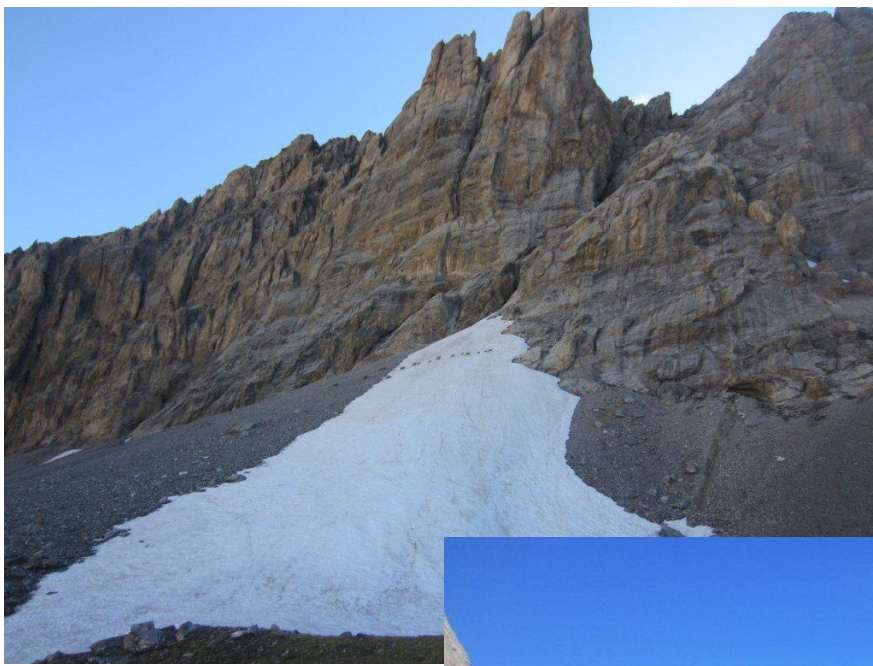
Les chamois traversent le haut du névé.