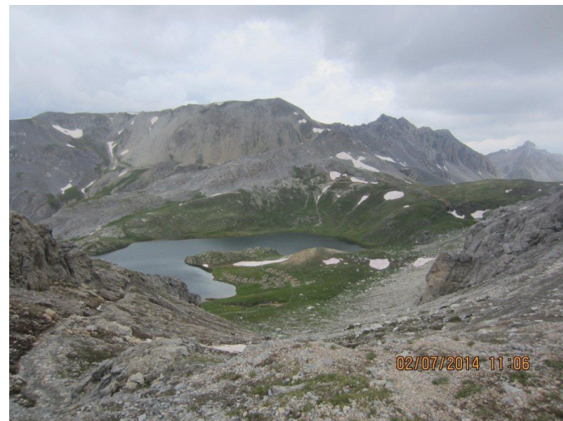
Le lac de Roburent (2428 m) s'offre à nous.

Bornes frontières posées suite au traité de Turin en 1760. Côté italien, la croix du royaume de Piémont-Sardaigne et côté français, la fleur de lys.