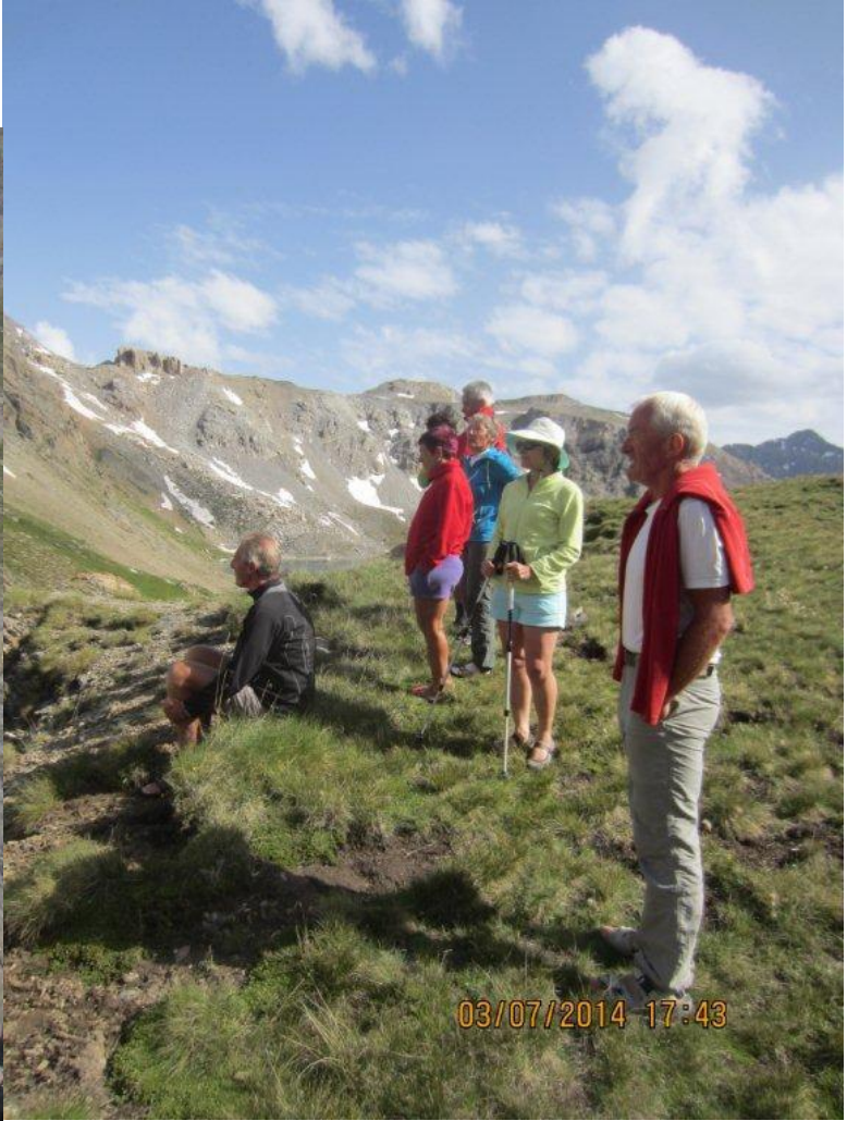
Au refuge du CHAMBEYRON, après une « mousse » bien méritée, nous contemplons la nature environnante et observons les marmottes, nombreuses dans tout le massif.