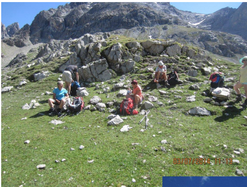
Mais déjà le Pas de la Goulette (2752m) se profile à l'horizon.