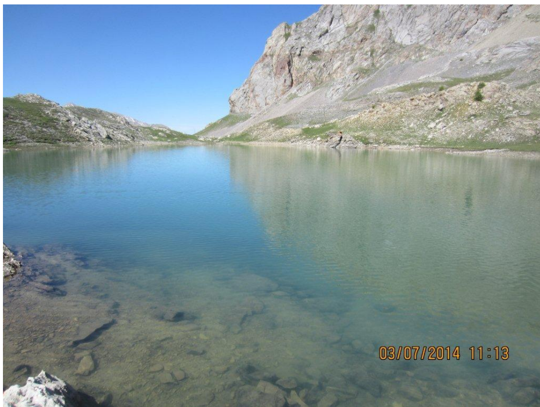
Nous sommes au lac du Vallonnet inférieur (2432m) où nous faisons une superbe pause repas .... Le bonheur !!!