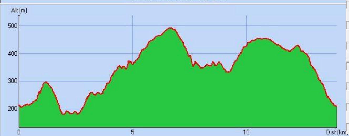
Tracé : Le Roubreau - 26/10/11