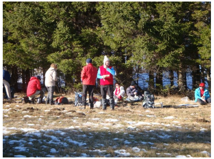
Il y a quand même un petit vent et nous trouvons à nous abriter derrière une haie de conifères pour casser la croûte, à la Brousse.