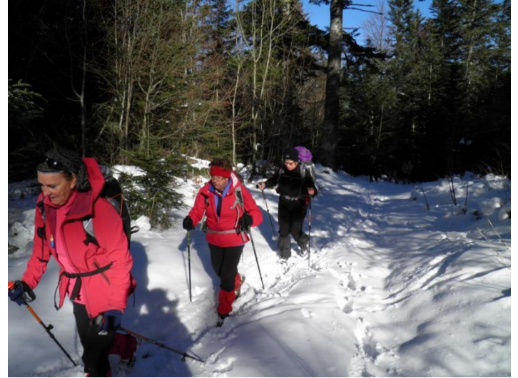
Après avoir repris des forces, il est temps de repartir en direction de la scierie d'Aiguebelle par le chemin forestier, et de ce côté-ci la neige est plus abondante.