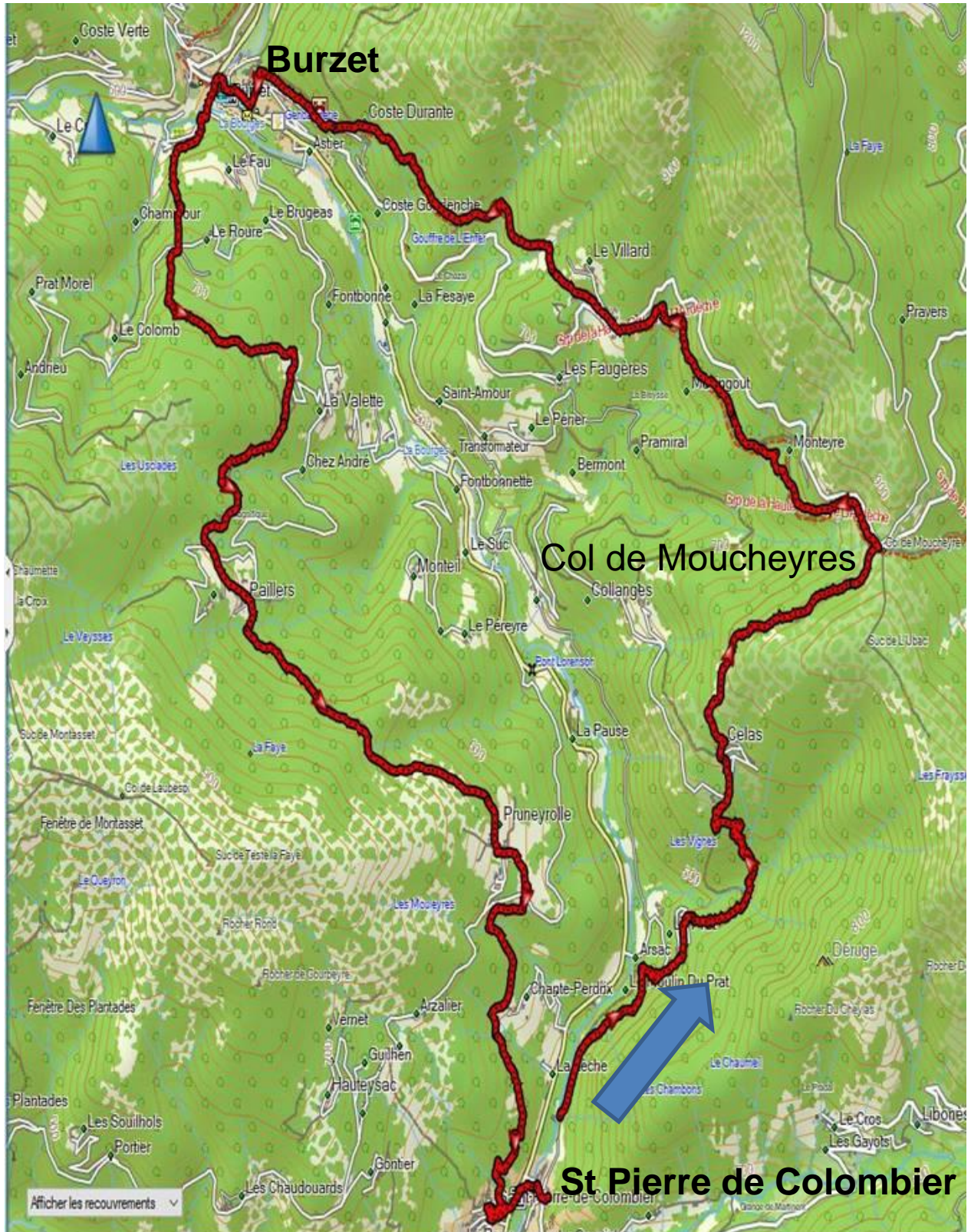
St pierre Colombiers-MNT

Il y a la parité – ou presque - dans notre groupe de 19 personnes prêtes à en découdre sur les chemins de St Pierre de Colombar. La météo est bonne et pendant notre parcours, nous avons du soleil, quelques giboulées de grésil, un ciel couvert, le vent plus ou moins fort au fil de la journée, mais globalement un bon temps d'hiver pour marcher.