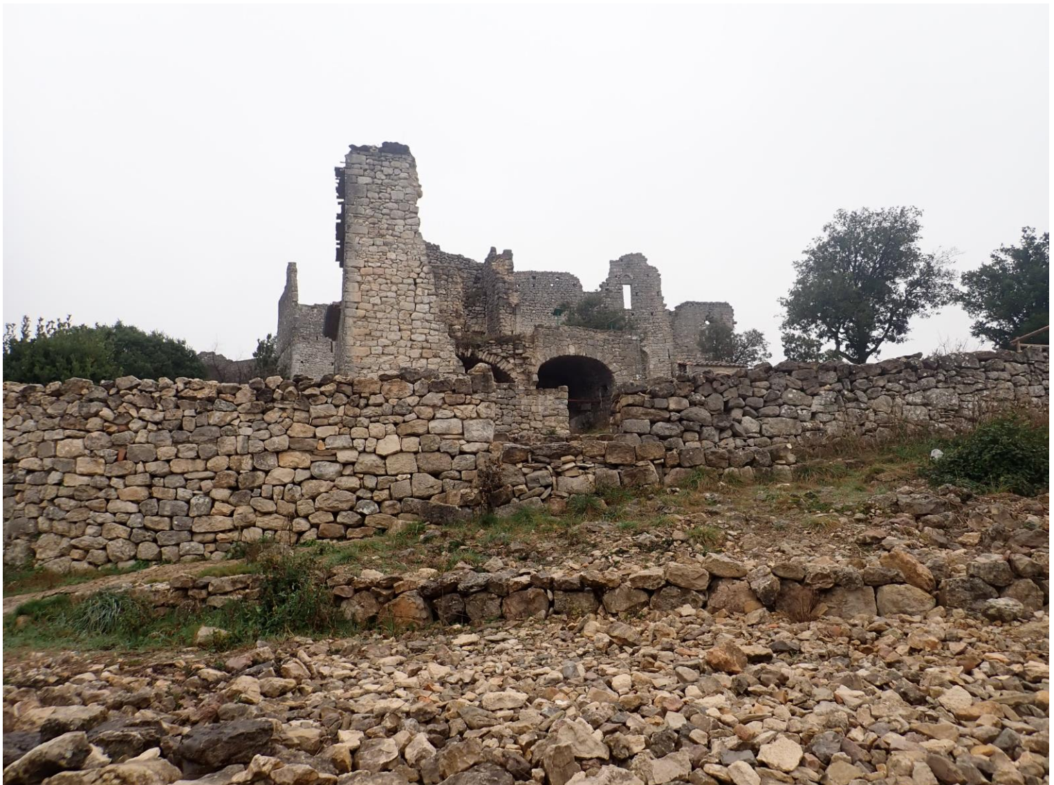
Le château d'Allegre. Autour du donjon occupé par le seigneur des chevaliers habitaient des maisons individuelles. Le village été situé au pied du château