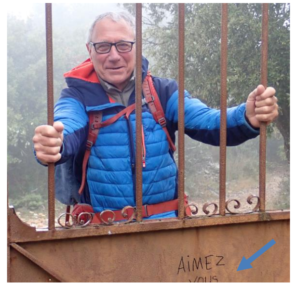
Chapelle St Saturnin