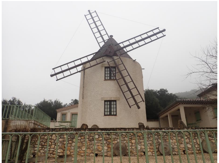
Hameau de Arlende