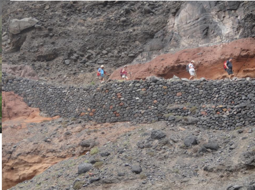
Après l'arrêt de mi journée, nous poursuivons la vallée qui nous mène à la mer.