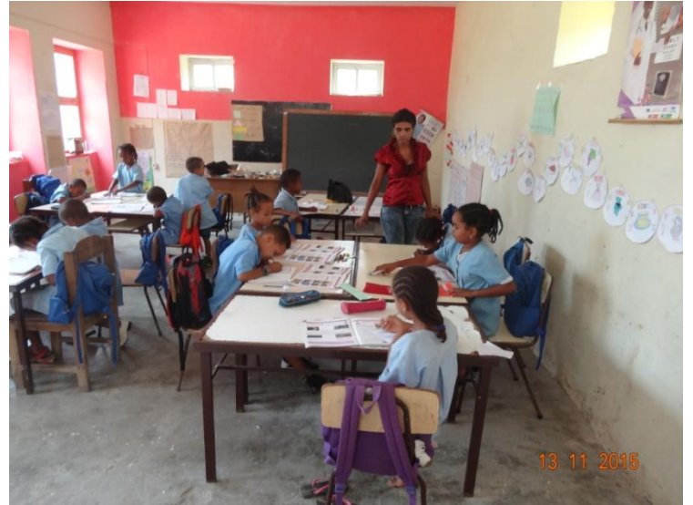
Les élèves sont en classe et nous nous arrêtons pour donner nos dernières fournitures à l'institutrice.