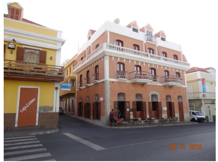
Photo de famille sur la plage et petit tour à pied dans la ville pour se dégourdir les jambes et faire un peu de change en monnaie locale 0,90 € = 100 escudos. Aujourd'hui dimanche, la ville est calme, tout est fermé et l'après midi peu de monde dans les rues. Le soir, repas dans un resto pour touristes avec musique et nuit à la pension Che Guevara (attention à l'eau qui est rare dans le pays!!!)

Lundi 9 nov. – Mindelo – Porto Novo - Paul