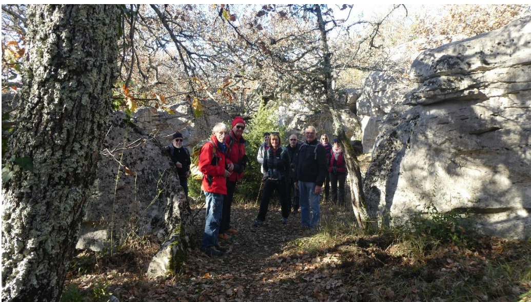
Petite pause dans une clairière entourée de rochers ruiniformes. Nous sommes sur le sentier René Roche et arrivons à la grotte.