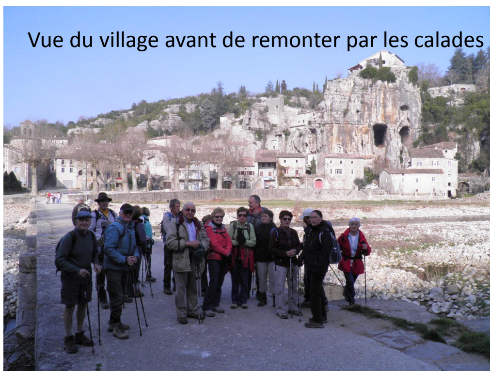
Vue du village avant de remonter par les calades