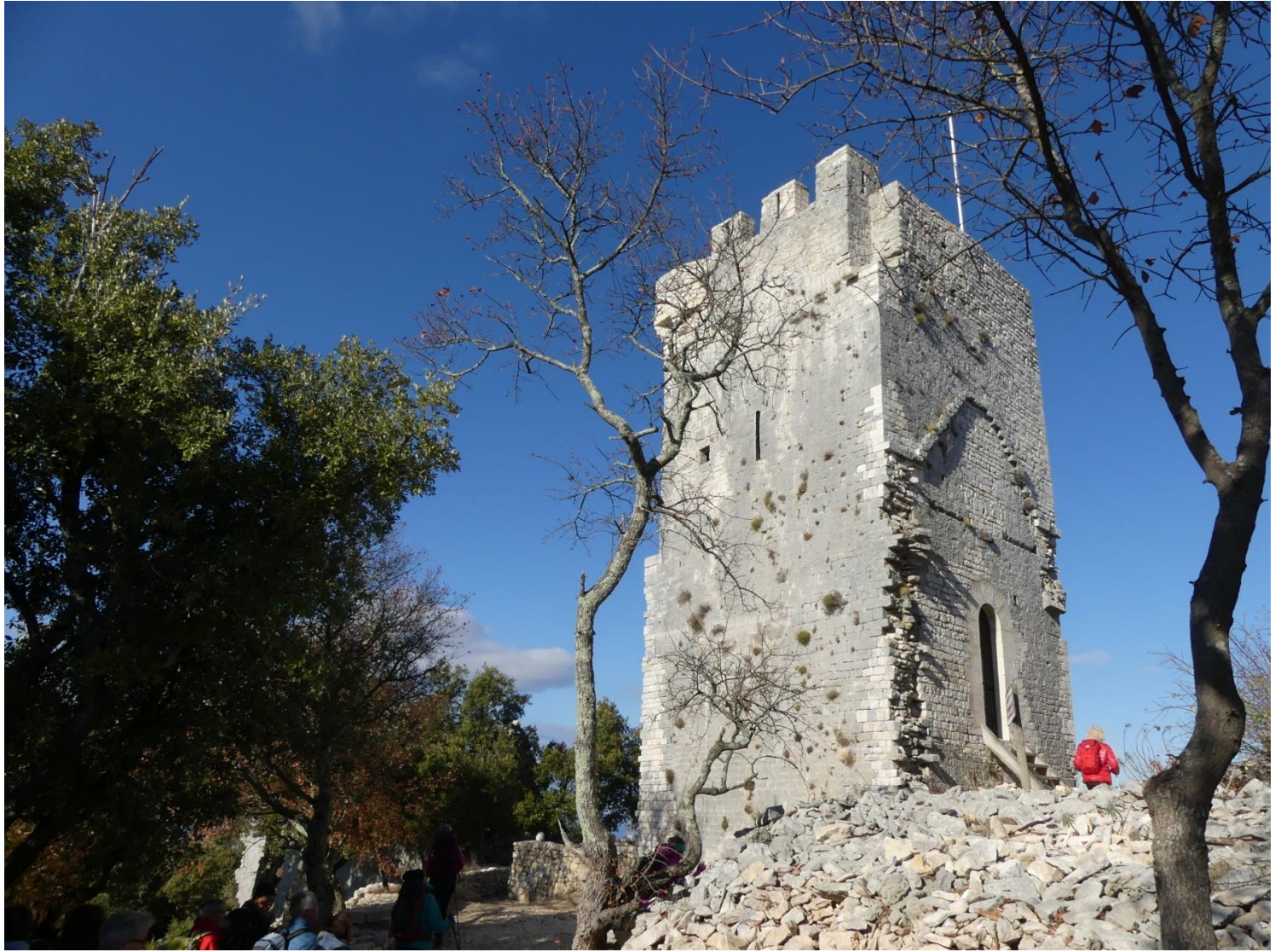
Les ruines du Castellans qu'une association restaure, depuis le pied de la tour un magnifique panorama