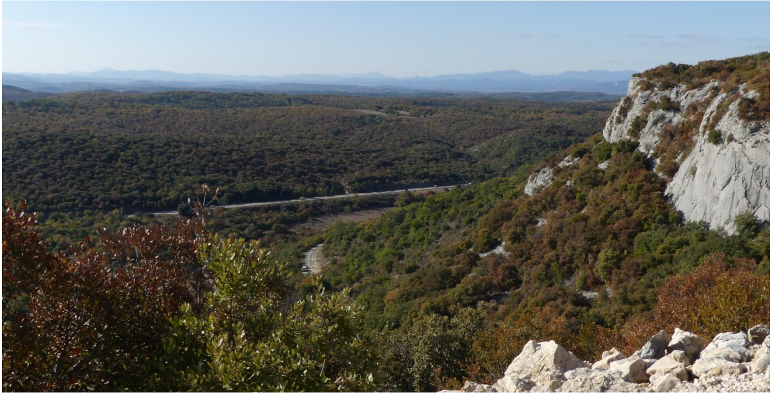
Au loin les Cévennes Gardoises Au sommet, Tour de garde contre les incendies La chapelle de La Mère admirable du Mt Bouquet