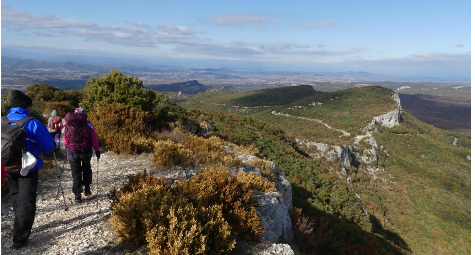
Cap au nord vers le Castellans, au loin les Cévennes Ardéchoises et la vallée de l'Ardèche